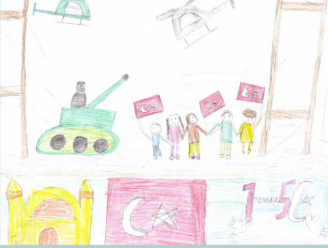
Mahmure Demet KASAP