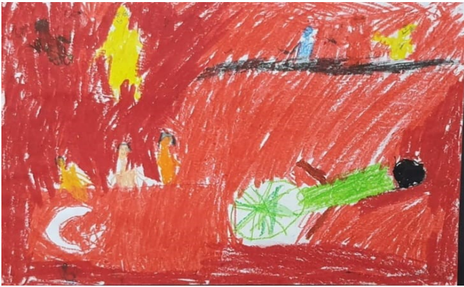
BERAT ÇEKİÇ 4/A