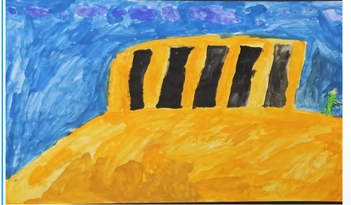
GÜNEŞ GÜRBÜZ 4/B