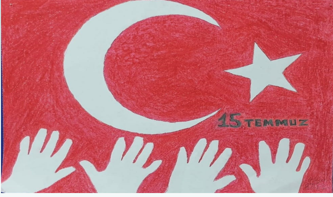
İLKİM MELİS ÖREN 4/A