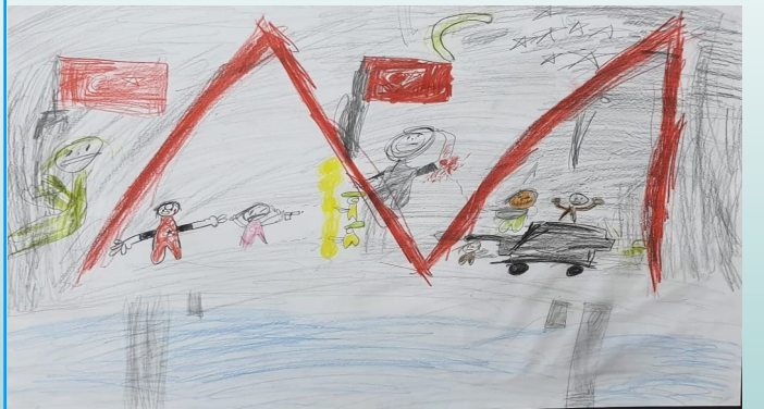
ARMAĞAN ÇAKAN 4/B