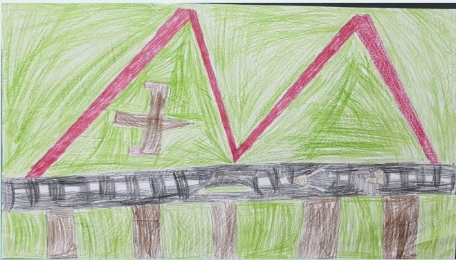
EYMEN AY 4/B