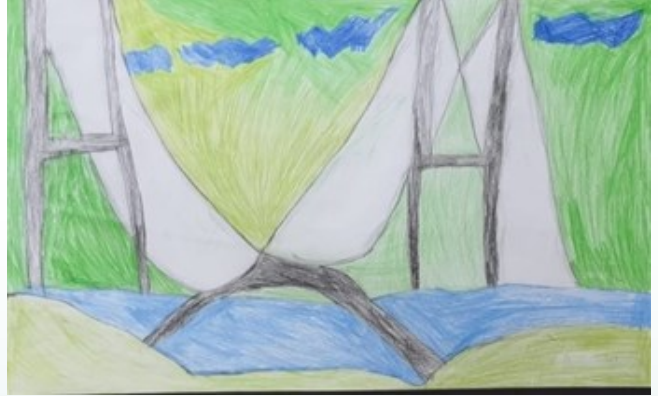
ASLI SÜLÜN 4/B