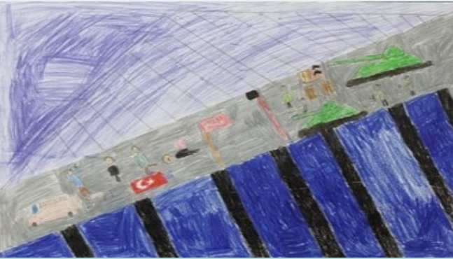
ZİYA EMİR YAVAŞ 4/A