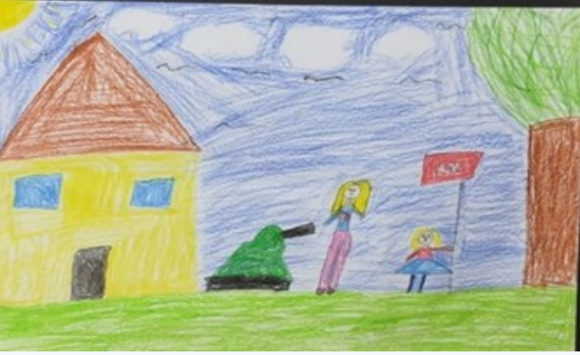
MELİSA UYAR 4/B