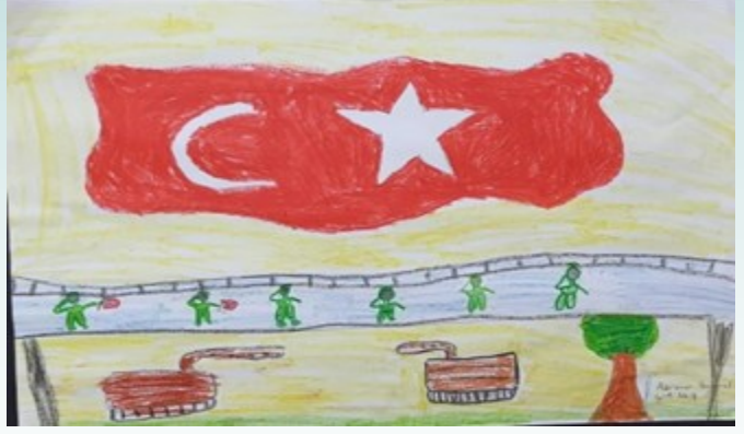
AZRA NUR HAMARAT 4/A