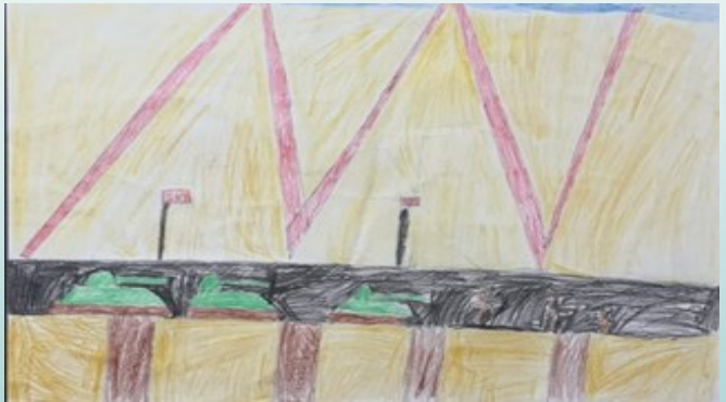
CEMRE ÖZBEK 4/B