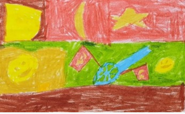
YAĞIZ YENİKÖY 4/A